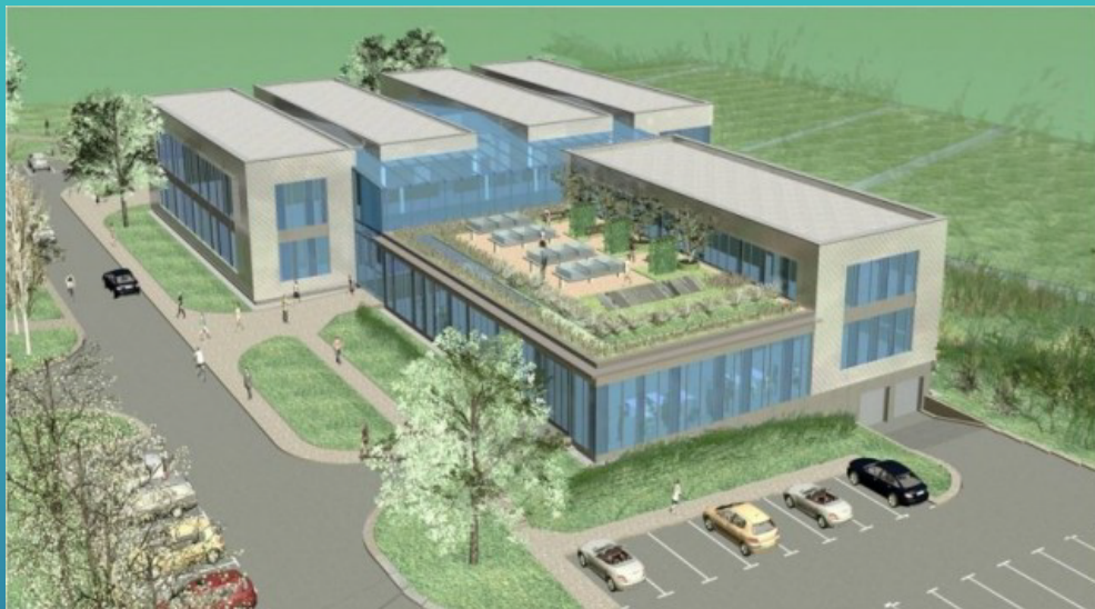
Nowoczesne Centrum Akwakultury i Inżynierii Ekologicznej