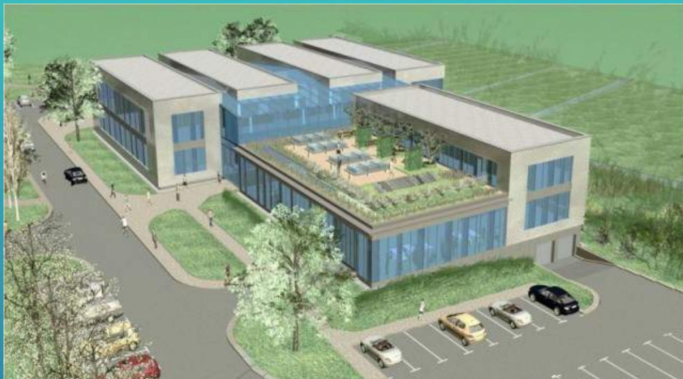
Nowoczesne Centrum Akwakultury i Inżynierii Ekologicznej